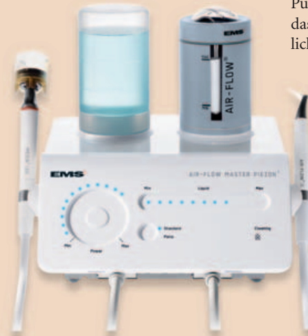
Air-Flow Master Piezon: Ergonomie und Leistungskontrolle auf minimalem Raum.

Flow Master Piezon effektiv behandeln. So glaubt man bei EMS, mit